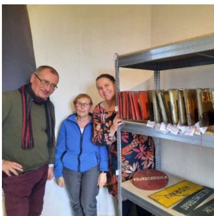
De vrijwilligers van het Trammuseum

8 collecties stelden zich in 2021 kandidaat en werden aan een evaluatie onderworpen. Iedere collectiebeheerder kreeg een rapport met belangrijkste bevindingen en tips om het behoud en beheer van diens collectie te optimaliseren. Op basis van de urgentie en mogelijkheden werden in 2022 2 collecties voor een piloottraject geselecteerd: de collectie van de Koninklijke Maatschappij voor het Belgisch Trekpaard (KMBT) en deze van het Museum voor het Belgisch Trekpaard.