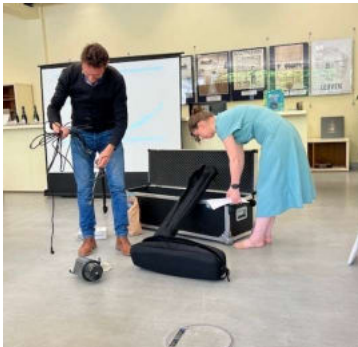
Onze polyvalente medewerkers volgden een opleiding bij FARO (op de foto: demo door FARO van de fotografieset).

We continueren onze dienstverlening als regionaal uitleenpunt voor de 'Decentrale uitleendienst ter ondersteuning van erfgoedbeheerders' van de Vlaamse Overheid (sinds zomer 2019 overgedragen naar FARO). In 2022 werd 8 maal van dit aanbod gebruik gemaakt. We boden hiermee een dienstverlening aan actoren zowel in als buiten onze regio.