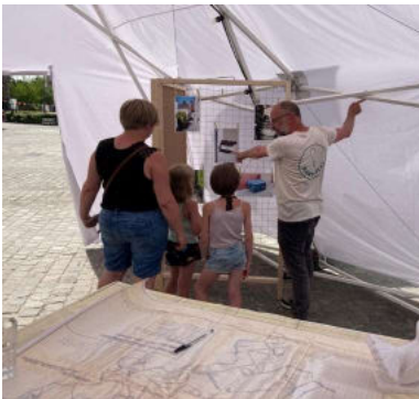
Randatlas in Alseberg

In het voorjaar van 2023 wordt het concept verder getest binnen het NT2-onderwijs en tegen het najaar hopen we via de bibliotheken 4 verschillende sets aan te bieden.