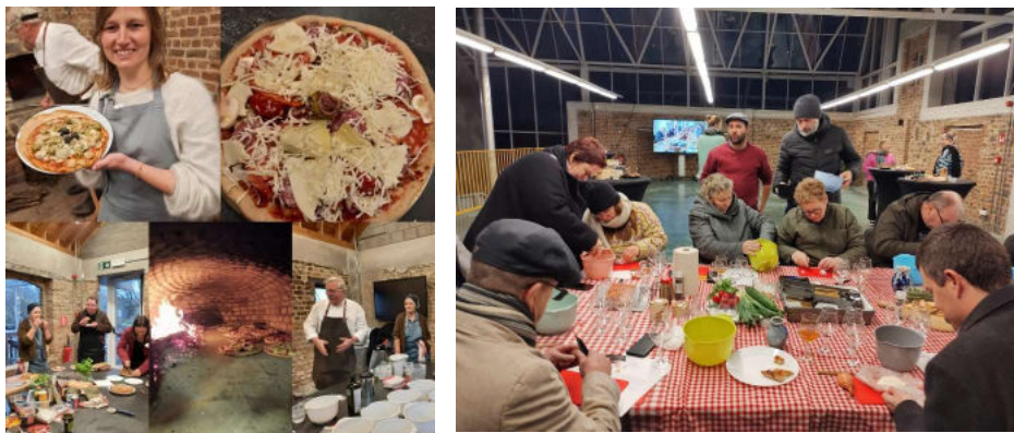
Pizza bakken in een traditioneel bakoven en de geheime van geuze ontdekken tijdens het eindejaarsnetwerkmoment.

Zo konden ze kennismaken met het vakmanschap van het gebruik van oude bakovens, geuze, landschapslezen en de foodarcheoloog.