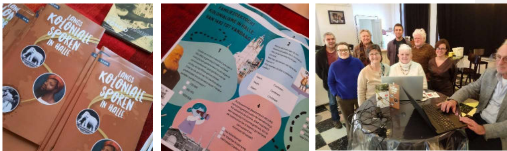
Een wandeling, kinderzoektocht en een schrijfsessie zetten het koloniale verleden op een kritische manier in de kijker.