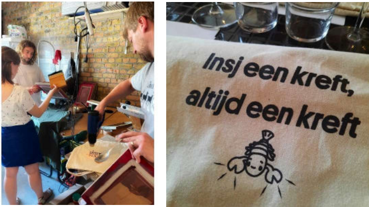
Aan de slag met het erfgoed van het vakmanschap van het drukken en het lokale dialect tijdens de praktiksafari voor cultuur- en erfgoedwerkers.

We brachten cultureel erfgoedwerkers samen tijdens een netwerk- en inspiratiedag in Oostende. Op deze manier faciliteren we kennisuitwisseling tussen de cultuur- en erfgoedprofessionals uit onze streek onderling en laten we ze kennis maken met inspirerende praktijken buiten onze regio.