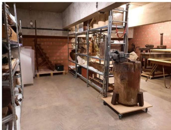
Het museumdepot van Den AST: voor en na.