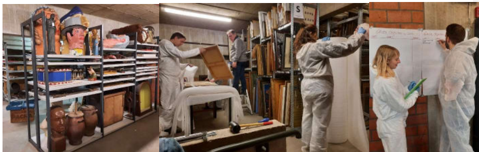
Enkele sfeerbeelden tijdens de Train the trainers-workshop in Den AST.

In kader van kennisuitwisseling binnen onze sector en het Vlaamse cultureel erfgoedveld werden we door ICCROM, KIK en CCI geselecteerd voor de Advanced Professional Development Course 'Becoming a Re-Org coach'. Deze kennis werd in de praktijk gebracht tijdens een 6 daagse TTT-re-orgworkshop