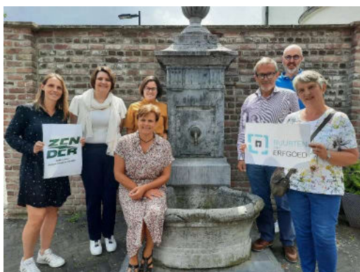
Enkele deelnemers aan het 'Buurten met Erfgoed'-traject tijdens het schooljaar 21-22 in Ternat.