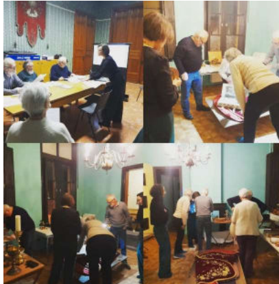
Vorming 'Religieus erfgoed inventariseren' in Pamel.

De collectie van Sint-Pieters-Bandenkerk uit Oudenaken werd gewaardeerd en een inventaris werd voltooid in Sint-Katarina-Lombeek. Voor Kokejane werd de registratie via het Erfgoedregister opgestart. Met de parochies van Pamel, Tollembeek en Liedekerke werden voorbereidende gesprekken gevoerd.