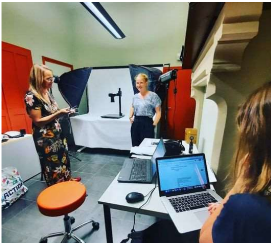
Op 6 juli verzamelden we met enkele erfgoedcellers bij Erfgoedcel Denderland voor de praktische uitwerking van 'Digitalisering voor vrijwilligers'