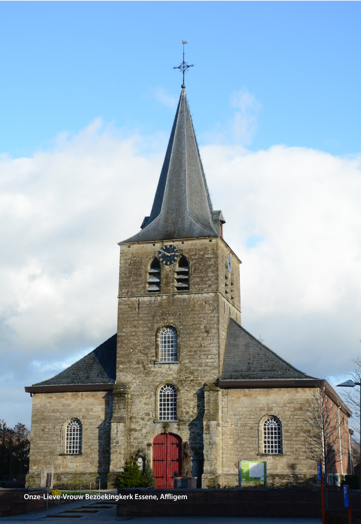
Onze-Lieve-Vrouw Bezoekingskerk Essene, Affligem