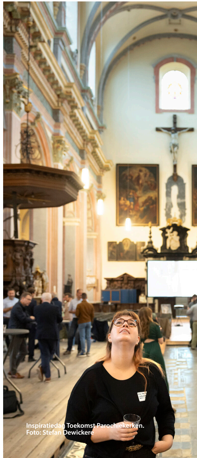
Inspiratiedag Toekomst Parochiekerken.

De professionele ontwikkeling en expertise van de eigen medewerkers wordt gewaarborgd door hen op regelmatige basis relevante opleidingen, studien en inspiratiedagen te laten volgen.