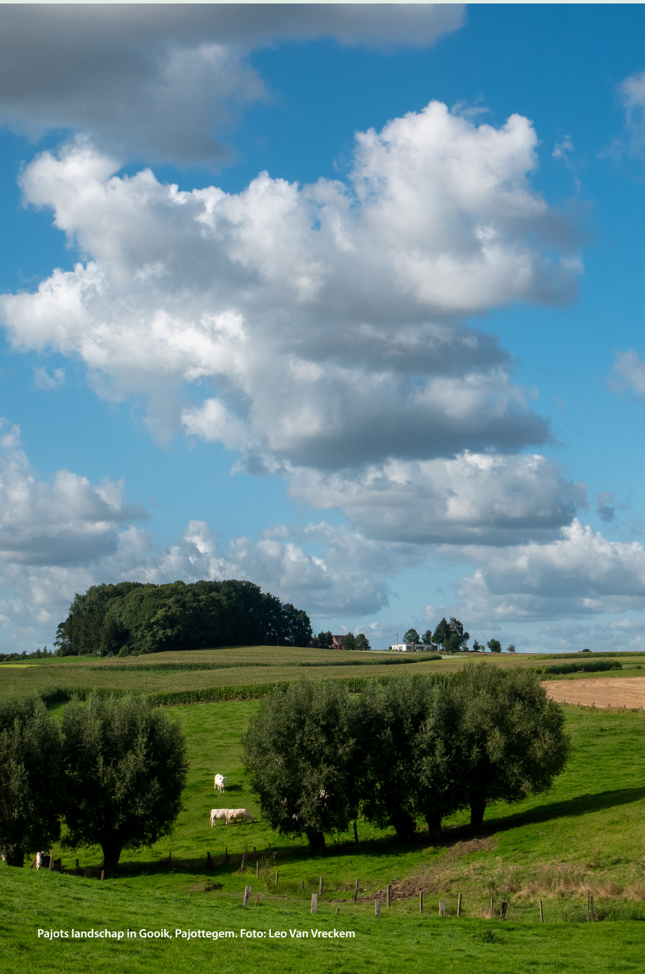
Pajots landschap in Gooik, Pajottegem.