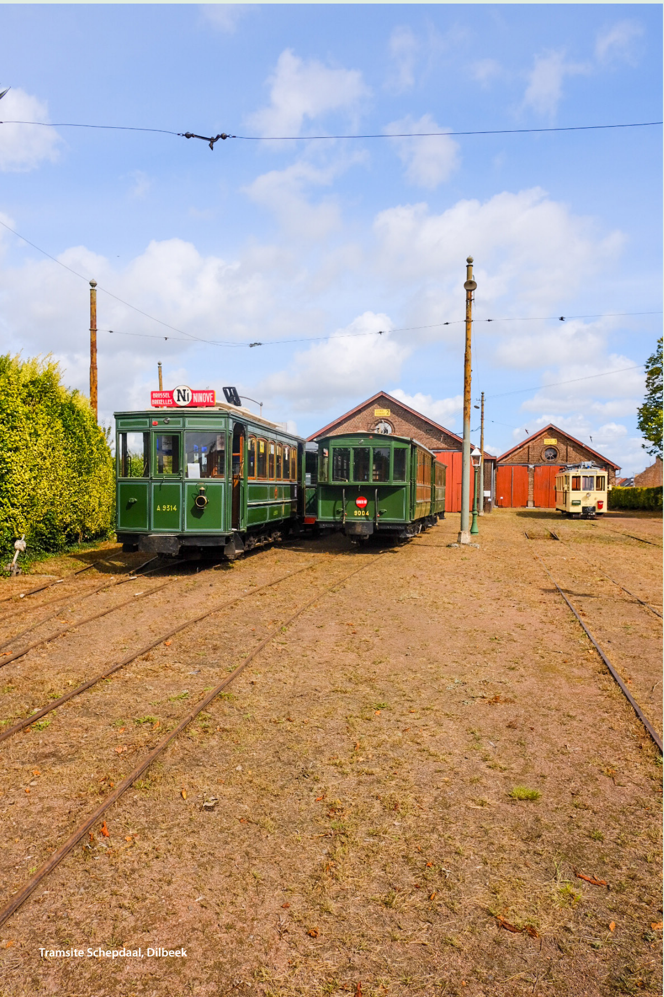
Tramite Schepdaal, Dilbeek