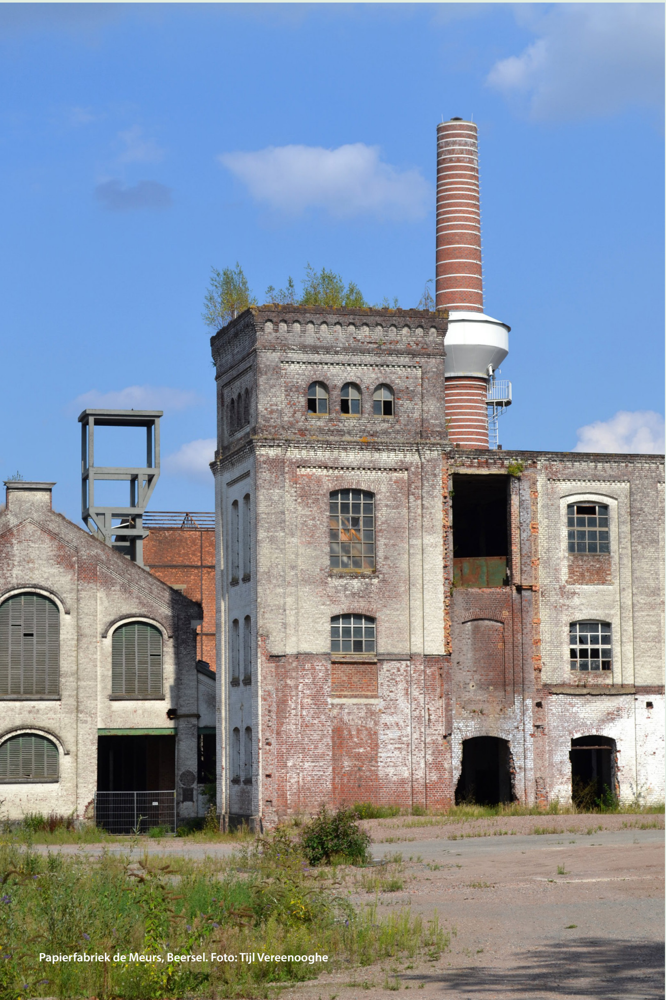
Papierfabriek de Meurs, Beersel.