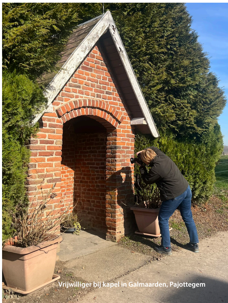
Vrijwilliger bij kapel in Galmaarden, Pajottegem

IOED ZENDER zet mee zijn schouders onder het concept 'Erfgoedambassadeurs' van Erfgoedcel ZENDER. Dit zijn mensen met een diverse achtergrond met interesse in erfgoed die zich in hun eigen omgeving ontpoppen als ware ambassadeurs voor het erfgoed van het Pajottenland en de Zennevallei. Wij ondersteunen en faciliteren hen bij het maken en verdelen van verhalen en het bereiken van specifieke doelgroepen.