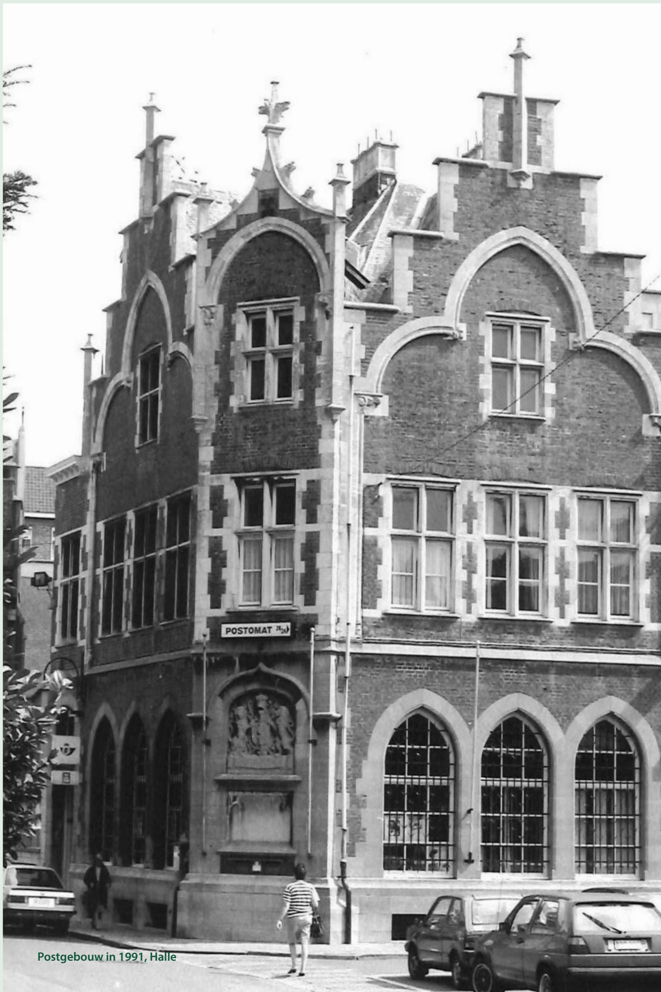
Postgebouw in 1991, Halle