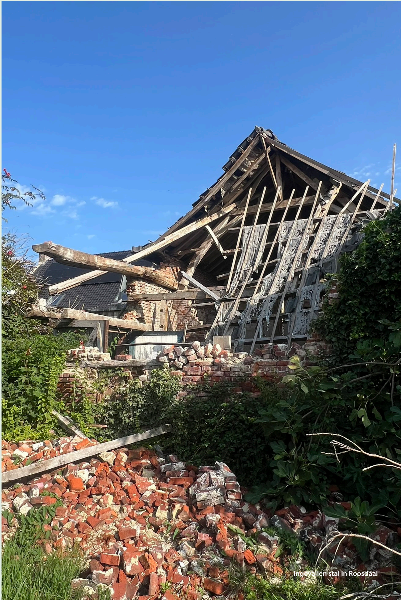
Ingevallen stal in Roosdaal