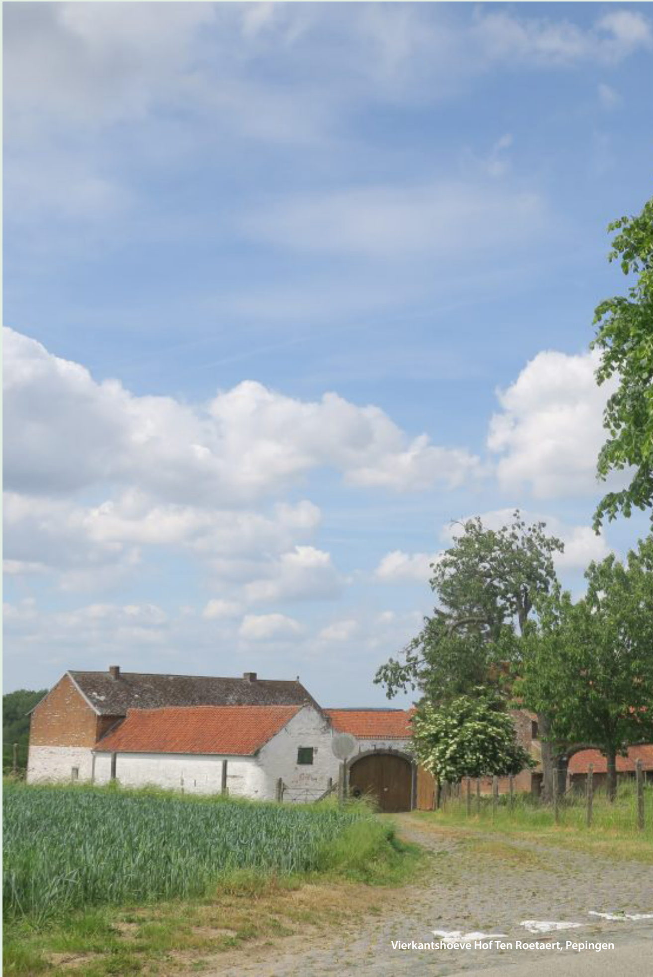
Vierkantshoeve Hof Ten Roetaert, Pepingen