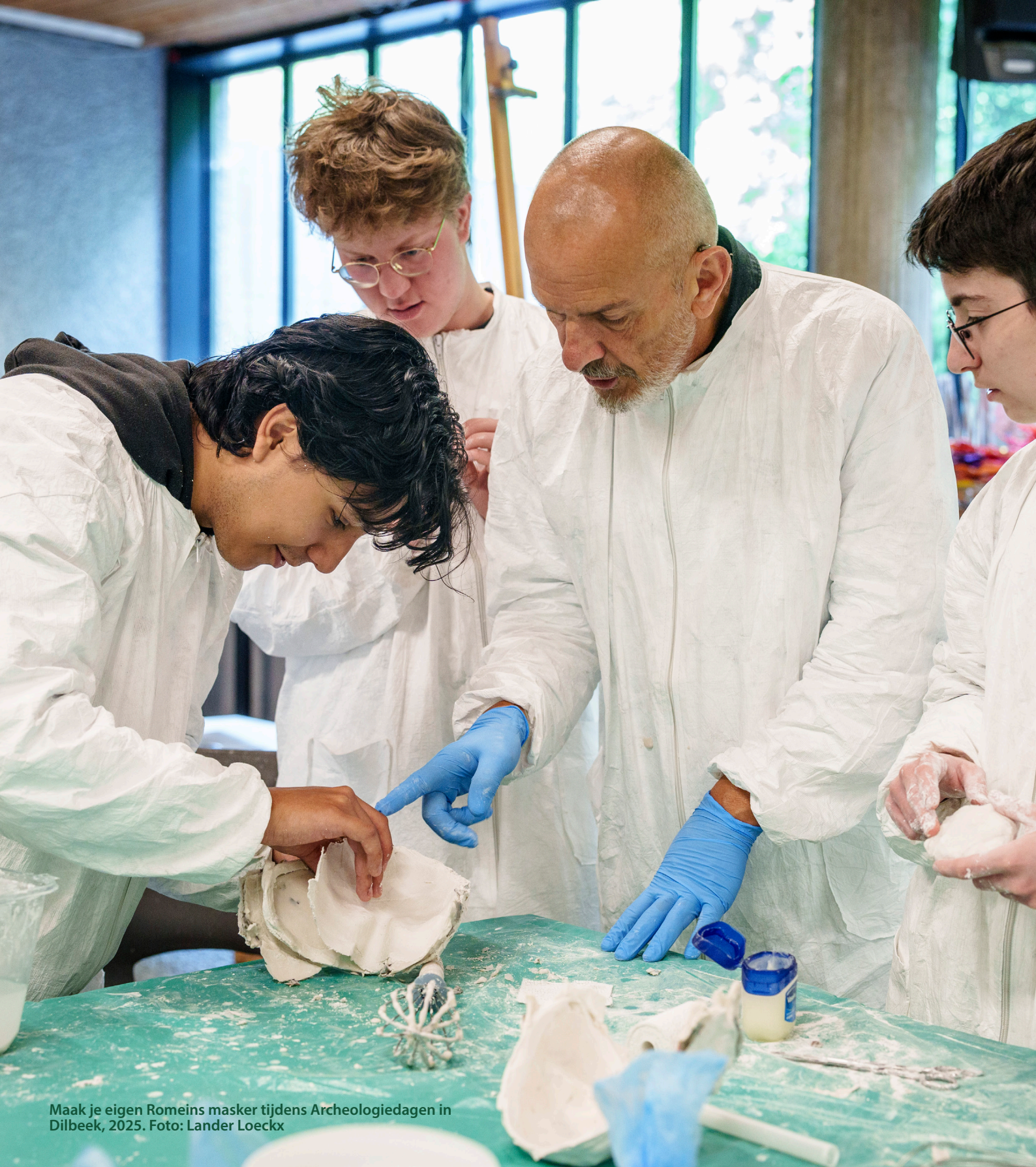
Maak je eigen Romeins masker tijdens Archeologiedagen in Dilbeek, 2025.