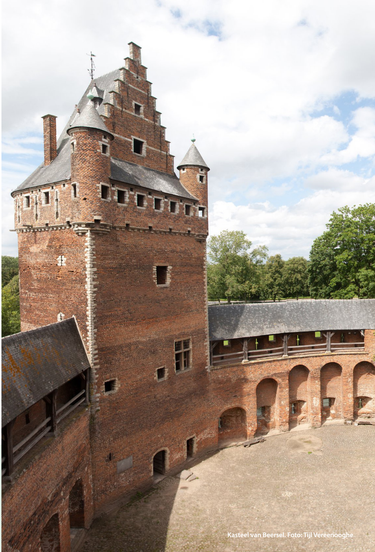
Kasteel van Beersel.