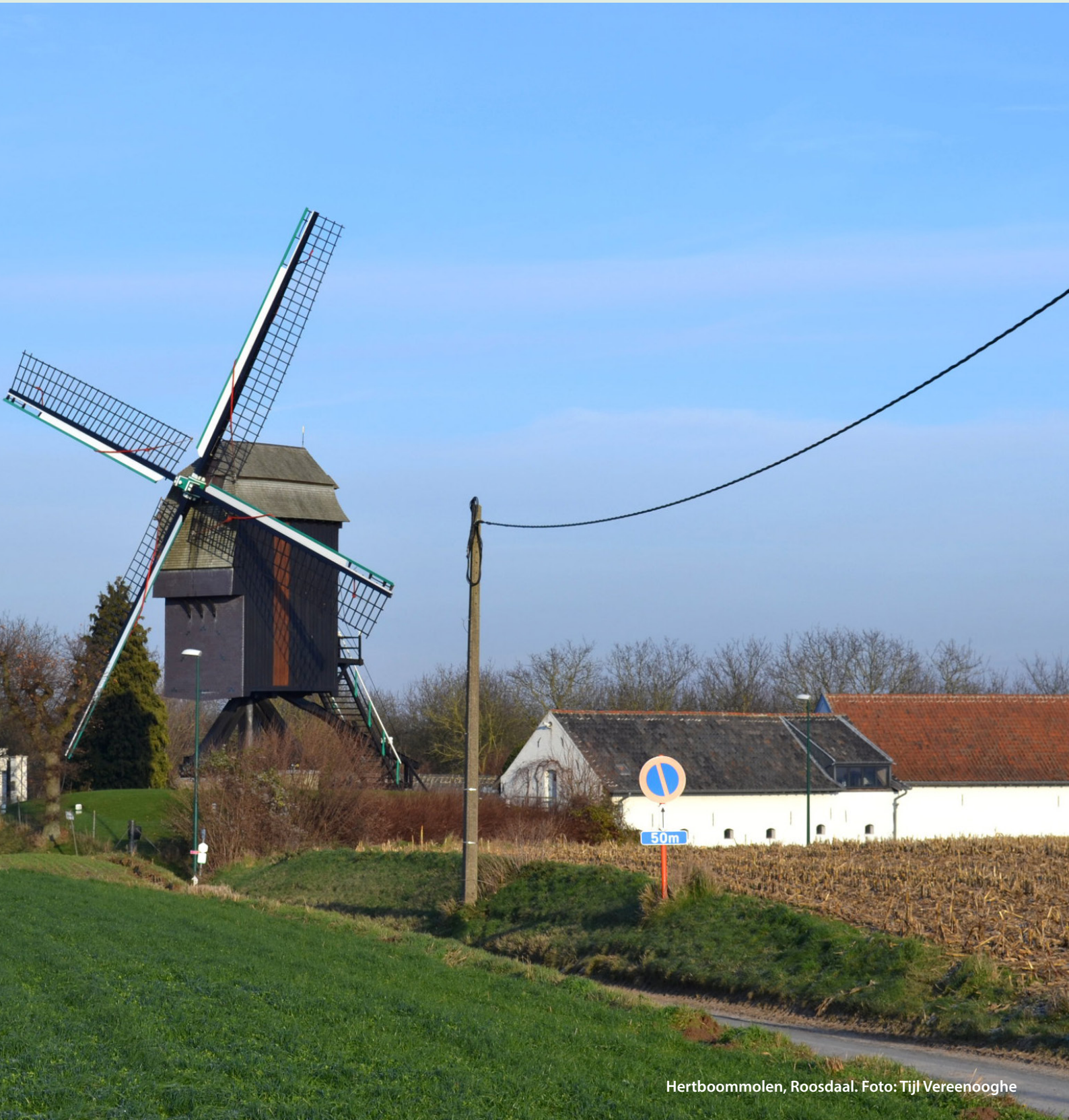
Hertboommolen, Roosdaal.