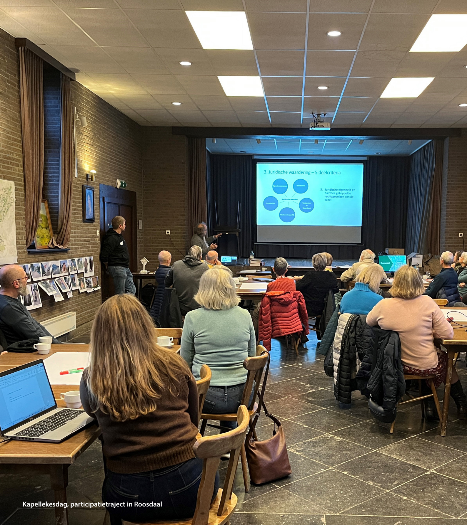
Kapellekesdag, participatietraject in Roosdaal