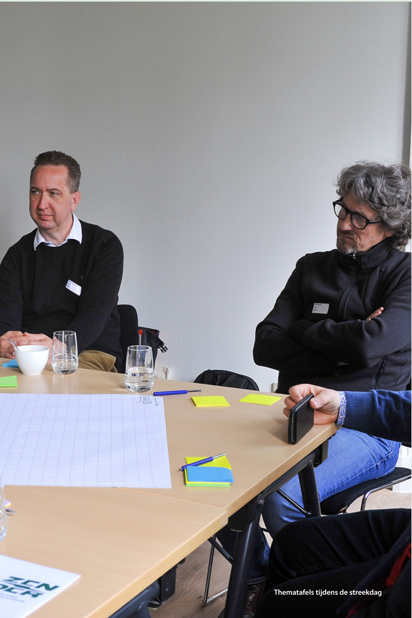
Thematafels tijdens de streekdag