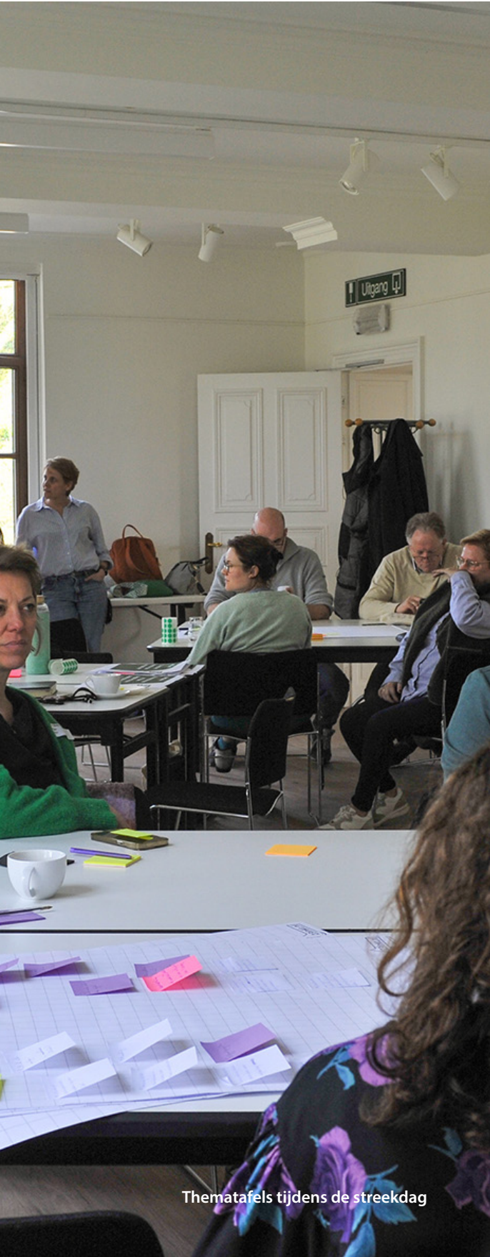
Thematafels tijdens de streekdag