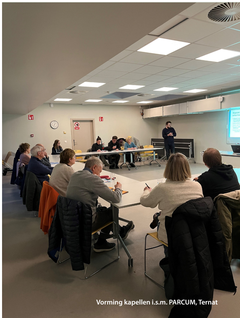
Vorming kapellen i.s.m. PARCUM, Ternat

Op regionaal niveau zijn streekorganisaties zoals Regionaal Landschap Pajottenland & Zennevallei (RLPZ), Pajottenland+, Natuurpunt, Klimaatpunt, Haviland en het erkende onroerend erfgoeddepot Agilas vzw actief. Zij bieden vooral ondersteuning bij projecten en dossiers. In het verleden werd soms nog te weinig gebruik gemaakt van hun expertise en vice versa; daar brengt de IOED de komende jaren verandering in. Binnen de intercommunale Haviland neemt de dienst omgevingshandhaving onder meer de rol als verbalisant onroerend erfgoed op zich. Gemeenten kunnen bij hen terecht voor advies en ondersteuning bij het naleven van de wetgeving inzake onroerend erfgoed. Een punt om in de volgende jaren te verkennen is hoe de samenwerking met Haviland vernauwd kan worden.