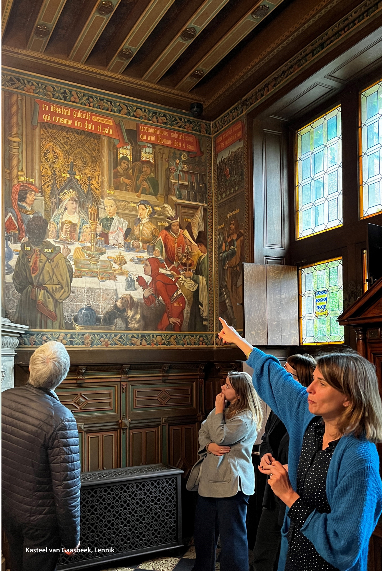
Kasteel van Gaasbeek, Lennik