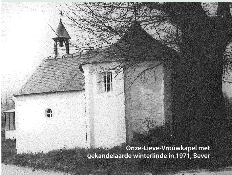
Onze-Lieve-Vrouwekapel met gekandelaarde winterlinde in 1971, Bever

IOED ZENDER rondt de kapelinventarisaties af in de aangesloten gemeenten. Indien er nieuwe gemeenten aansluiten bij de IOED, starten we een nieuw inventarisatietraject op met als doel een regio-dekkende kapelinventarisatie te bekomen.